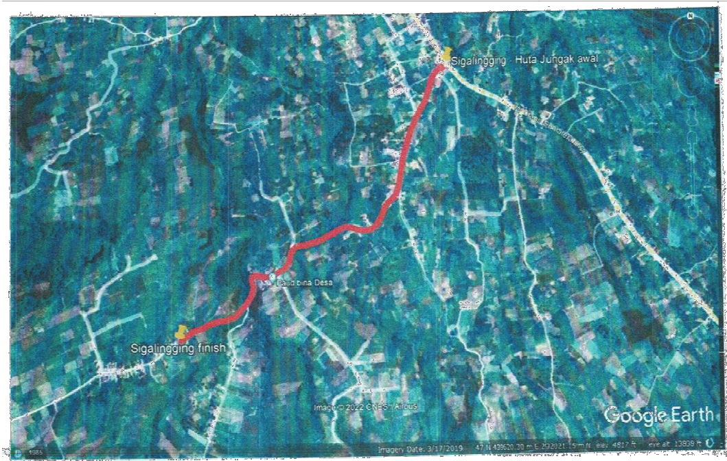
Gambar 3.1 Lokasi Pekerjaan Ruas Jalan Sigalingging Huta Jungak