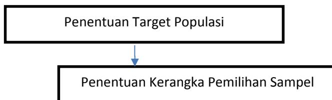
Gambar 3.1 Tahap Proses Pemilihan Sampel

Menurut Kuncoro, “ Sampel adalah bagian dari populasi yang diharapkan dapat mewakili populasi penelitian ” 17 . Untuk memperoleh sampel yang dapat mewakili karakteristik populasi, diperlukan metode pemilihan sampel yang tepat. Informasi dari sampel yang baik akan dapat mencerminkan informasi dari populasi secara keseluruhan. Sampel dalam penelitian ini adalah melalui penarikan sampel non probability karena jumlah populasi yang banyak, sehingga peneliti mengambil sampel untuk mewakili populasi. Dalam penelitian ini penulis menggunakan teknik purposive sampling . Purposive sampling merupakan teknik penentuan sampel dengan pertimbangan khusus sehingga layak dijadikan sampel. Tahapan proses pemilihan sampel seperti pada gambar 3.1.