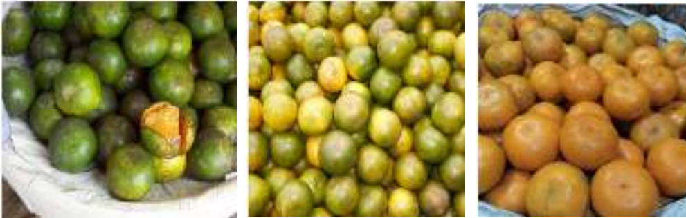
Gambar 1. Tingkat Kematangan Jeruk Siam Madu

termasuk dalam kriteria tingkat kematangan III (Qomariah et al. , 2013). Adapun tingkat kematangan jeruk siam madu dapat dilihat pada Gambar 1.