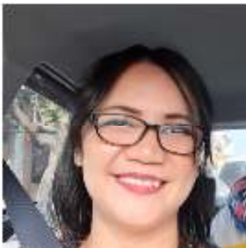
Gambar 1: Foto Komposer

Berikut ini adalah profil komposer dan juga profil pianis: