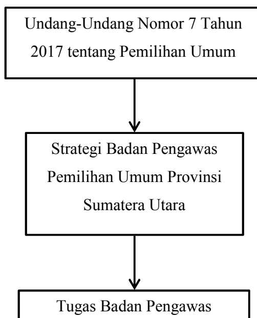
Gambar 2.1 Kerangka Berpikir

Untuk Meningkatkan pengawasan penyelenggaraan pemilihan umum yang maksimal dibutuhkan pengawasan pemilihan umum yang profesional, serta mempunyai integritas, kapabilitas dan akuntabilitas melalui Bawaslu sehingga terlaksananya pemilihan umum yang bersih, jujur, dan adil dengan spirit demokrasi dan kearifan lokal setiap provinsi di Indonesia.